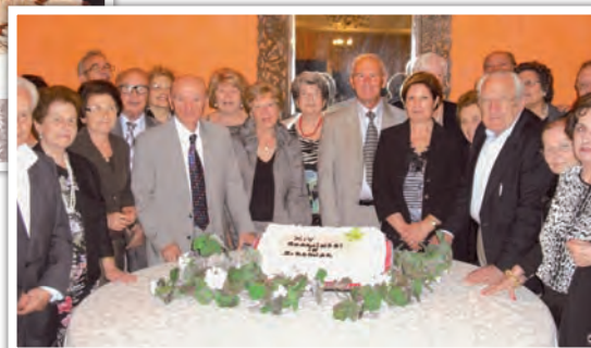
Foto di gruppo