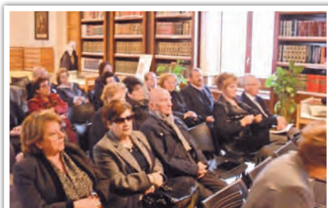
Conferenza su "Rosolini: Immagini e Territorio"