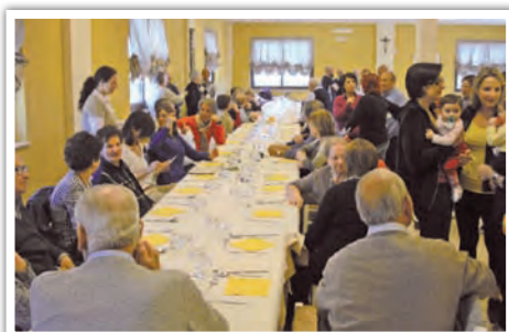
Tradizionale "Mangiata di ricotta" a Modica