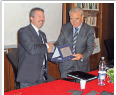
Consegna di una Targa ricordo