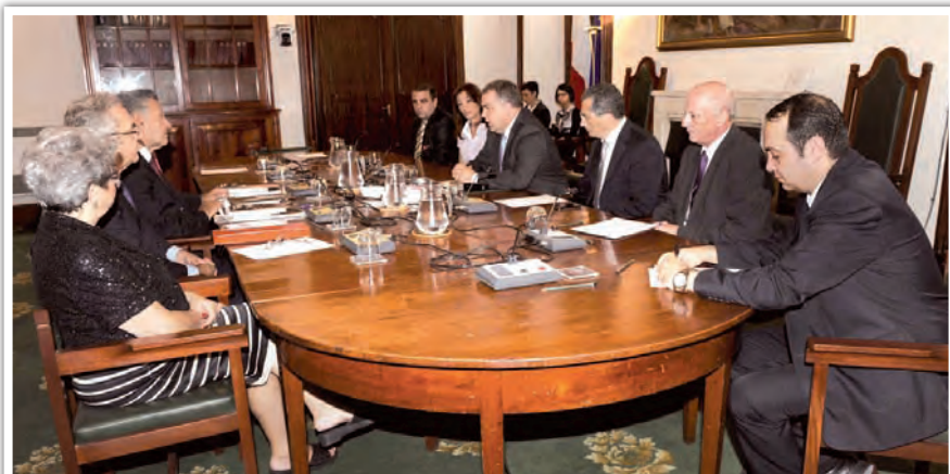
Delegazione siracusana a Malta

Il Convegno si è concluso a Malta, alla Camera dei Deputati, con vari incontri all'Istituto di Cultura, Associazioni Culturali ed economiche varie.