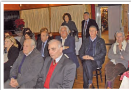
Conviviale degli auguri di "Natale 2013"