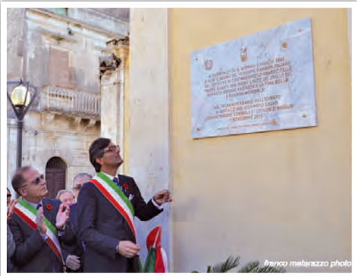
Scopertura della lapide, in Piazza ai Caduti a ricordo del Summit di Rosolini del 1943